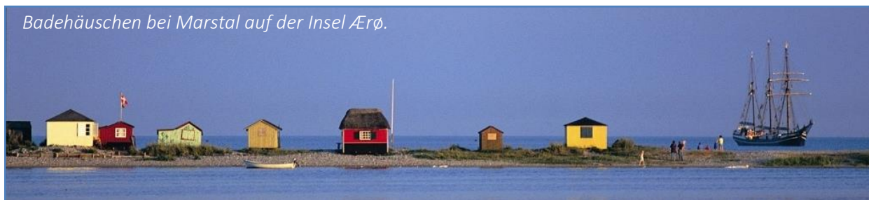
Badehäuschen bei Marstal auf der Insel Ærø.

Rechtzeitig verlassen wir Marstal und nehmen Kurs auf die Kieler Förde. Noch einmal Frischluft und Segeln vor Schleswig-Holsteins Ostseeküste. Bei gutem Wetter und ruhiger See wird es möglich sein, mit dem Beiboot der Eye of the Wind eine Foto-Tour rund um das Schiff durchzuführen. Anschließend haben wir Gelegenheit, vor Strände am Westufer der Kieler Förde oder in der Eckernförder Bucht eine Nacht am Ankerplatz zu verbringen – ein weiterer Höhepunkt jeder Segelreise!