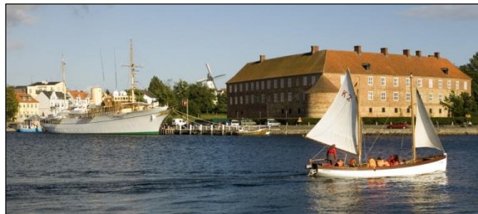
Hafen und Schloss von Sønderborg

Nach dem Frühstück heißt es „Leinen los!“ Am östlichen Förde-Ufer sehen wir das Marine-Ehrenmal von Laboe; bald darauf erreichen wir auf Höhe von Kiel-Leuchtturm die offene Ostsee. Nach einem Tag unter Segeln überqueren wir die unsichtbare deutsch-dänische Seegrenze und finden im Schutzhafen von Sønderborg auf der Insel Als einen Liegeplatz für die Nacht. Haupt-Attraktion ist das Schloss mit seinem Park, das sich in Sichtweite unseres Anlegers befindet. Lohnenswert ist ein Bummel durch die Altstadt in ihrer typisch-dänischen Beschaulichkeit und entlang der Hafenzeile mit historischen Kaufmannshäusern.