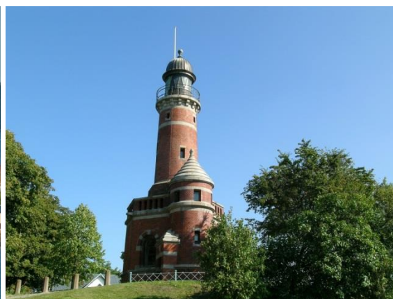
Kiel-Holtenau ist der Ausgangspunkt unserer Reise. Links die Schleuse des Nord-Ostsee-Kanals, rechts der Leuchtturm beim Liegeplatz