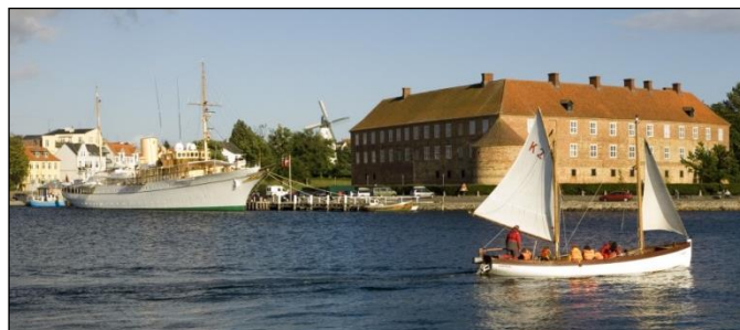
Hafen und Schloss von Sønderborg

Nach dem Frühstück heißt es „Leinen los!“ Am östlichen Förde-Ufer sehen wir das Marine-Ehrenmal von Laboe; bald darauf erreichen wir auf Höhe von Kiel-Leuchtturm die offene Ostsee. Nach einem Tag unter Segeln überqueren wir die unsichtbare deutsch-dänische Seegrenze und finden im Schutzhafen von Sønderborg auf der Insel Als einen Liegeplatz für die Nacht. Haupt-Attraktion ist das Schloss mit seinem Park, das sich in Sichtweite unseres Anlegers befindet. Lohnenswert ist ein Bummel durch die Altstadt in ihrer typisch-dänischen Beschaulichkeit und entlang der Hafenzeile mit historischen Kaufmannshäusern.