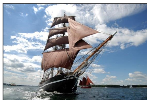
Eye of the Wind in der Kieler Förde

Die hier beschriebene Route ist optional und kann sich auf Grund der Wind- und Wetterverhältnisse kurzfristig ändern. Alternativ können auch die Häfen von Bagenkop oder Faaborg an der dänischen Küste angelaufen werden. Wohin die Reise geht, entscheidet der Kapitän oft noch am selben Tag und – wann immer möglich – natürlich auch unter Berücksichtigung Ihrer Wünsche. Auf diese Weise erleben Sie den Törn als eine angenehme Mischung aus Abenteuer und Komfort, aus Mitmachen und Genießen.