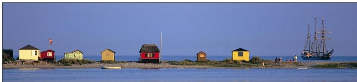
Badehäuschen bei Marstal auf der Insel Ærø

Nach einer Umrundung der Südspitze der Insel Als überqueren wir den Kleinen Belt und nehmen Kurs auf Marstal im Südosten der dänischen Insel Ærø. Der Ruhm der Hafenstadt als Dänemarks Segelschiffszentrum ist nicht übertrieben. In den Jahren um die Jahrhundertwende war eine Flotte von über 300 Handels-Seglern hier beheimatet. Der Hafen ist auch heute noch ein Ort mit regem Betrieb, mit Stahl- und Holzschiffswerften, Motorenfabriken und Fährhafen. Die Häuser der Seeleute sind dicht am Hafen gebaut. Dazwischen winden sich die engen Straßen und Gassen in reizender Unordnung. Am Hafen liegt das international bekannte Seefahrtsmuseum, das mehr als 200 Schiffsmodelle und weitere Ausstellungsstücke von allen sieben Weltmeeren beherbergt.